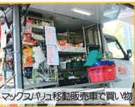
マックスバリュ移動販売車で買い物