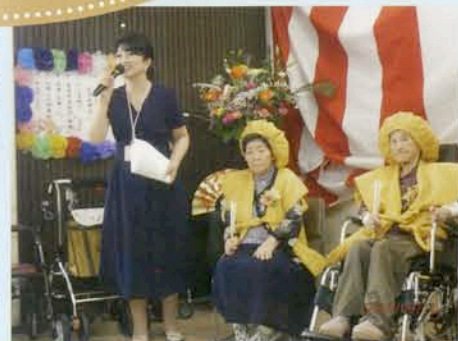
敬老祝賀会 米寿のお祝い