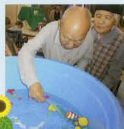
縁日レクでおとっと!