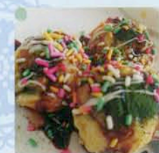
まんまるトースト