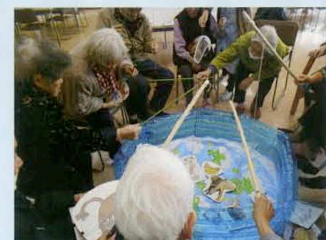
レクリエーション委員会 誰がたくさん釣れるかな?