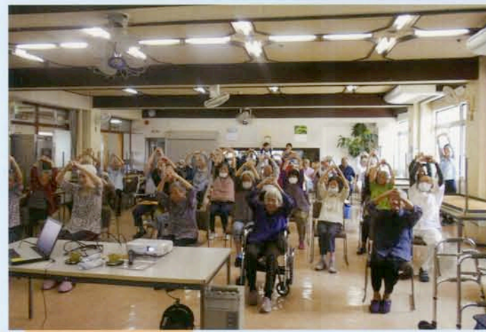
転倒予防委員会 周南市役所から講師をお招きしいきいき百歳体操を実践中!