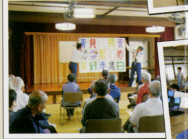
山口県警交通安全教室