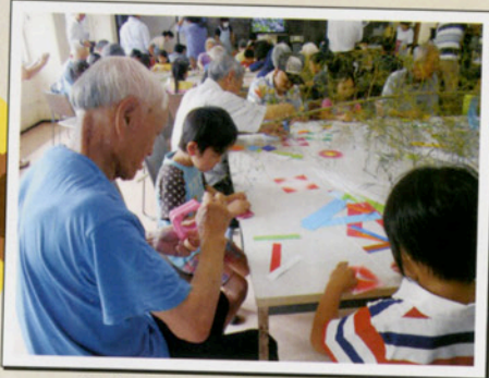
園児と七夕飾り作成中☆