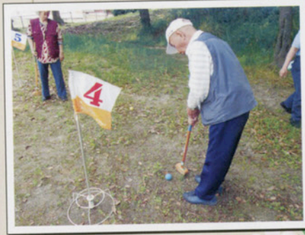
グランドゴルフ大会