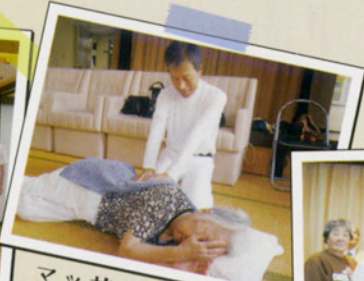
マッサージ奉仕慰問 周南市視覚障害者福祉協会